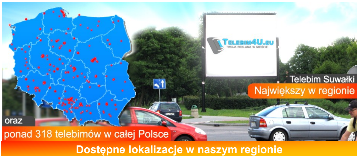
Telebim w Gołdapi 5 m2